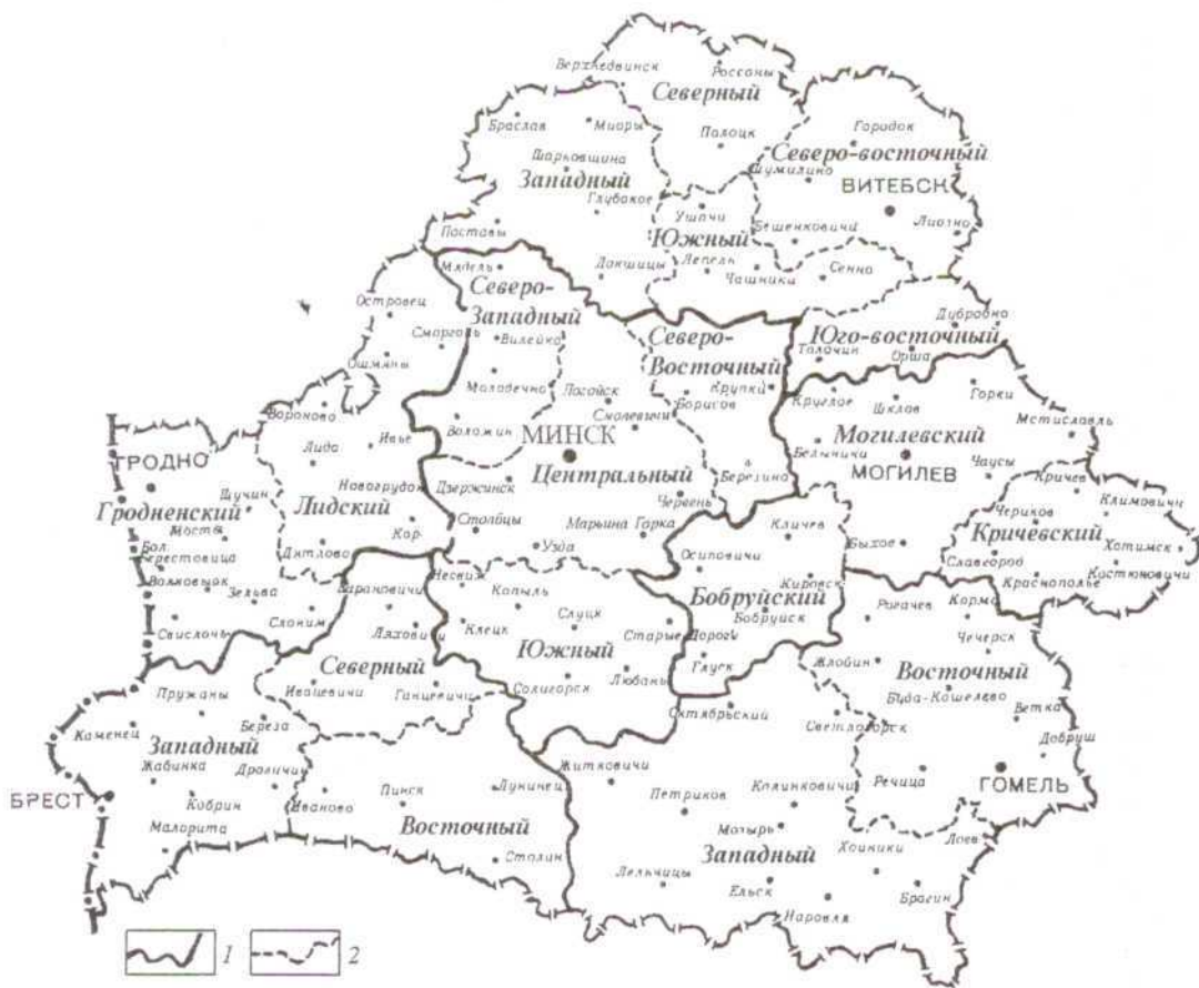
Рис. 3. Схема экономического районирования Беларуси по административному делению 1 – границы областных экономических районов; 2 – границы внутриобластных экономических подрайонов

ровался или формируется определенный комплекс со специфическим сочетанием отраслей. Экономико-географические подрайоны в пределах областей также были выделены на основе объединения нескольких административных единиц (районов) в соответствии с выявленными различиями в экономико-географическом положении, природных ресурсах, историческом прошлом и экономических условиях [рис. 3].