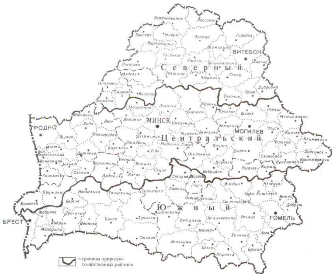
Рис. 4. Схема природно-хозяйственного районирования Беларуси (по С.И. Сидору)

Социальная направленность данного подхода к районированию потребовала включения в число учитываемых факторов комфортности жизнедеятельности людей качества окружающей среды, и по существу современное социально-экономическое районирование переросло в социо-эколого-экономическое. Его цель – выделить такие территории, в пределах которых осуществляется удовлетворение основных потребностей человека (в труде, бытовом и культурном обслуживании, рекреации), а также возможно создание благоприятных условий для эффективного, сбалансированного развития производства, расселения, природы.